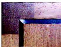
Plateau avec joint creux laqué noir RAL 9005